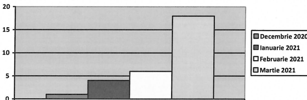
Fig. 1. Numărul cererilor depuse lunar de CMI la Primăria Sectorului 3