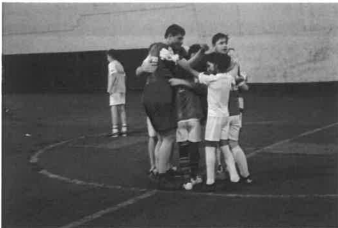
Campionatul RBLs (ediția II)

Evenimentul a fost organizat în parteneriat cu liderii de afaceri din România. Fundația Romanian Business Leaders este o comunitate de antreprenori, manageri și profesioniști din diferite domenii. În cadrul acestui eveniment, în data de 5 mai 2017 copiii au jucat fotbal în echipe mixte cu adulți sub forma unui campionat.