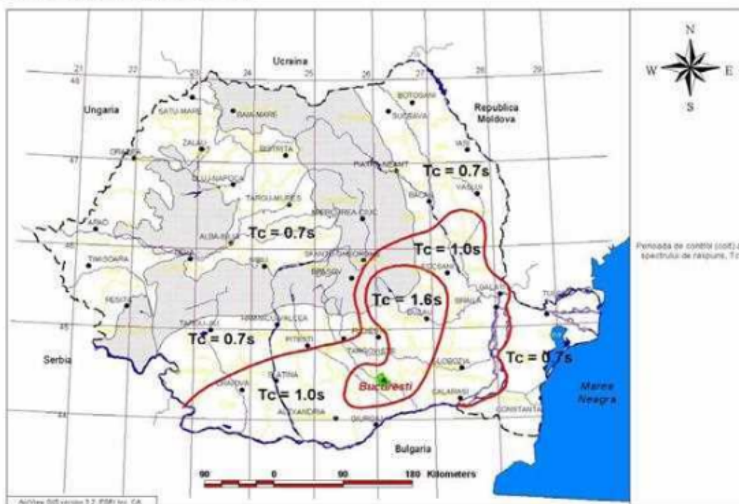
Figura 3.2 Zonarea teritoriului Romaniei in termeni de perioada de control (colt), T_c a spectrului de raspuns