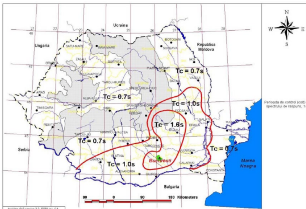
Figura 3.2 Zonarea teritoriului României în termeni de perioada de control (colt), T_c a spectrului de răspuns