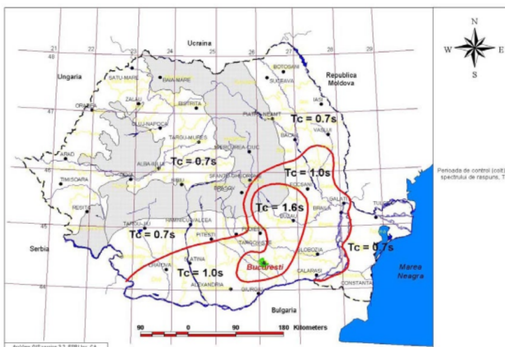
Figura 3.2 Zonarea teritoriului României in termeni de perioada de control (colt), T_c a spectrului de raspuns