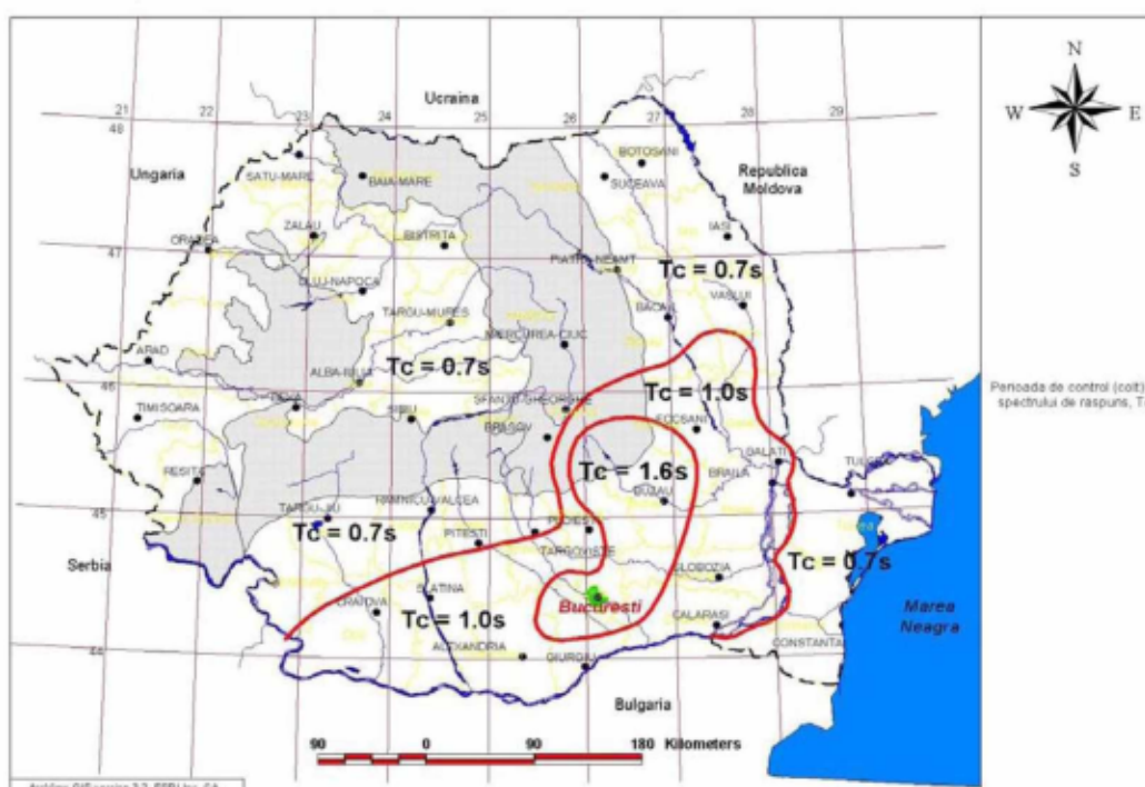
Figura 3.2 Zonarea teritoriului României în termeni de perioada de control (colt), T_c a spectrului de raspuns