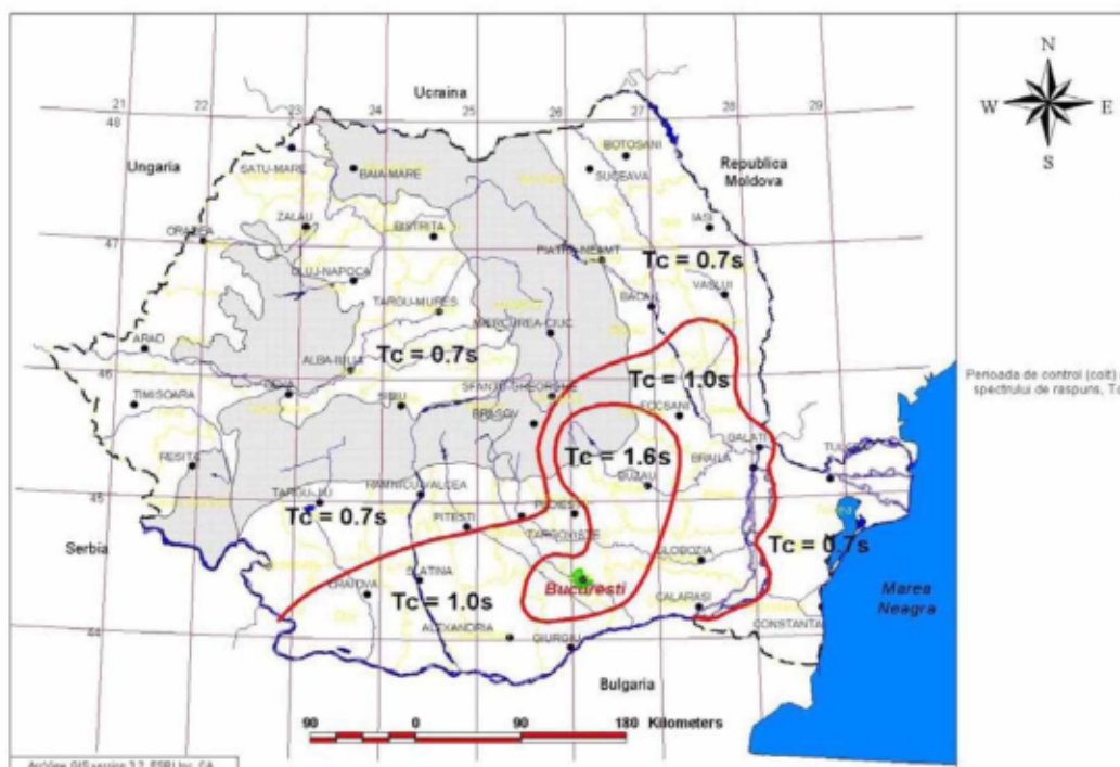
Figura 3.2 Zonarea teritoriului României în termeni de perioada de control (colt), T_c a spectrului de raspuns