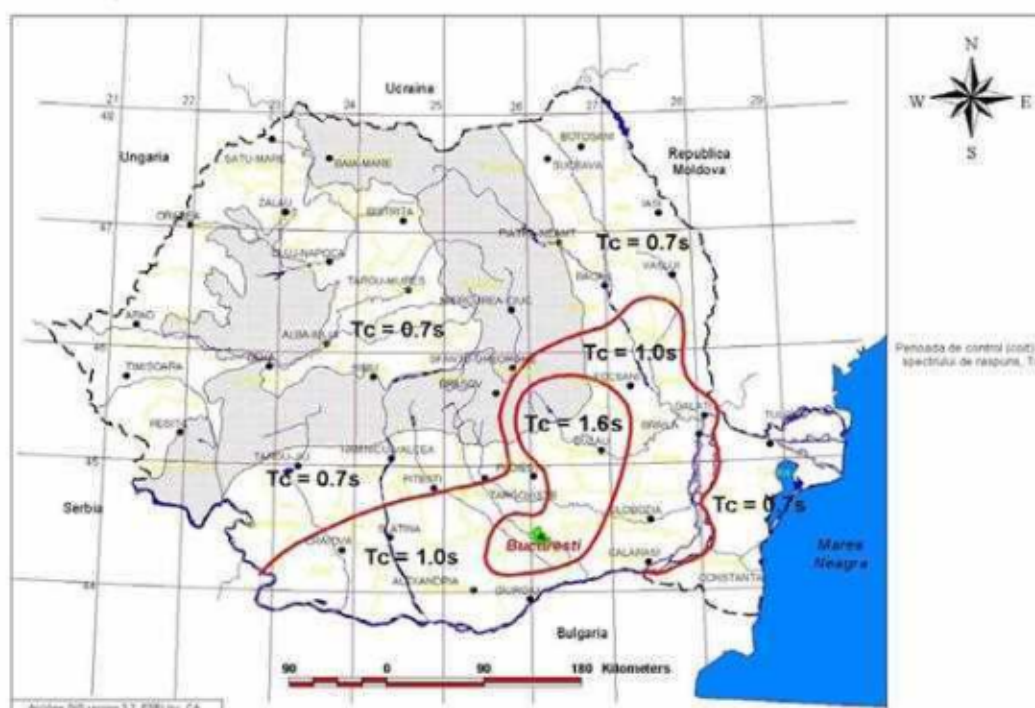
Figura 3.2 Zonarea teritoriului României în termeni de perioada de control (colt), T_c a spectrului de răspuns